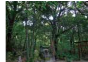
牛床詣所 岳参りの聖地