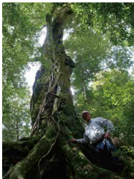
吉田の森 スタジイの巨木