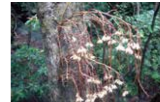
タカツラン(口永良部)