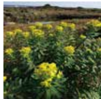
春田浜