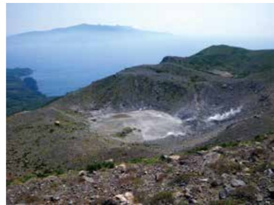
口永良部島 屋久島を望む