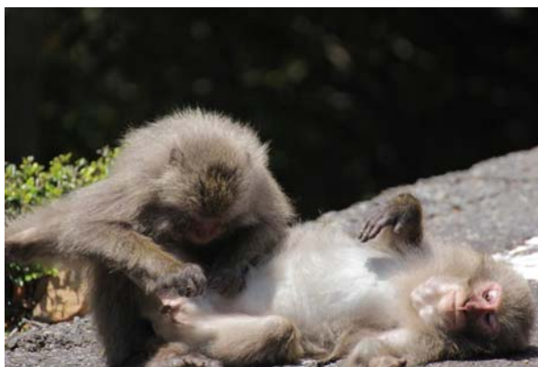
道路上でグルーミング