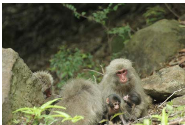
3匹の母親が集まってグルーミング