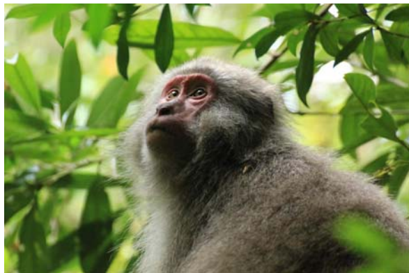
木の上で休むサル