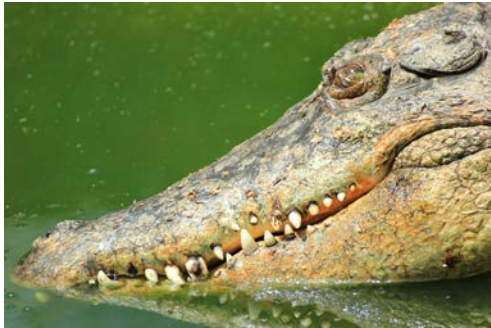
クロコダイルファームにて