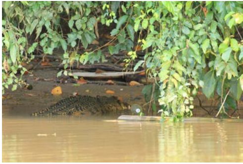
イリエワニ（リバークルーズにて）