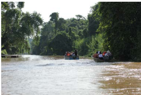
リバークルーズ（朝）の様子