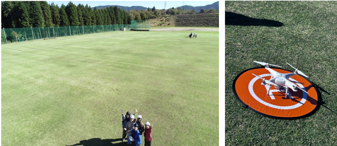
図2 ドローンで撮影した画像とドローン離陸地点

午前にはドローンシミュレーターとミニドローンを用いて飛行練習を行った。法律で制定されている高度である150mを超えずに飛行することや、離着陸、自動で離陸地点に戻ってくる機能などを練習した。ドローンは円盤状であるため進行方向を見失うことが多く、ドローンを回転させて後方が常に自分の方を向くようにするのがコツだと理解した。ドローンの組み立て方を学んだ後、午後はグラウンドに出てドローンの飛行と上空からの写真・動画撮影を行った。最初はコントローラーのスティックの動かし方を忘れて慌てることが多かったが、その間もドローンは上空で安定して浮遊していたため初心者でも問題なく操縦ができた。操縦していて一番怖かったのは、スティックを勢いよく倒してドローンが遠くに行きすぎてしまった瞬間だった。障害物検知によって電線の近くで止まり自動帰還機能を使うことができたが、これらの機能がなかったらドローンを壊してしまう可能性があった。自動帰還の重要性を改めて感じた。ドローンの走行速度を制御するのは難しかったが、操作に慣れた後はドローンから写真や動画を撮って楽しむことができた。ドローンを使うだけでドラマのオープニングやミュージックビデオのような動画が撮れることが面白く、さまざまな動画を撮影した。